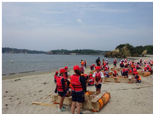
5年生 いかだづくり